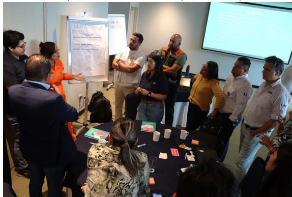
Taller Centroamericano de Preparación Logística (mayo 2024)