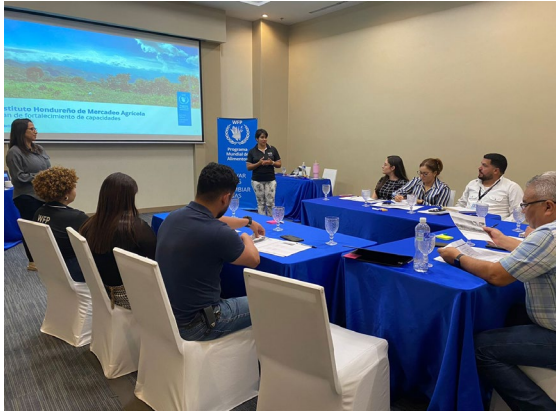
Taller de Priorización de Plan de Fortalecimiento de Capacidades del IHMA (abril 2024)