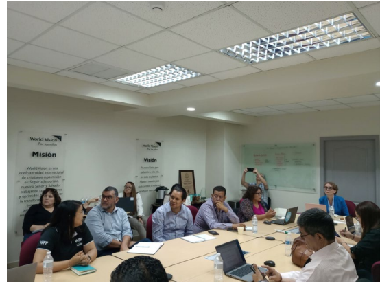
Presentación de Análisis de Preposicionamiento en Honduras (abril 2024)