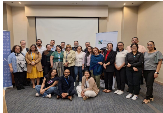
Jornada de Actualización de Plan de Contingencias de Inundaciones y Huracanes (junio 2024)