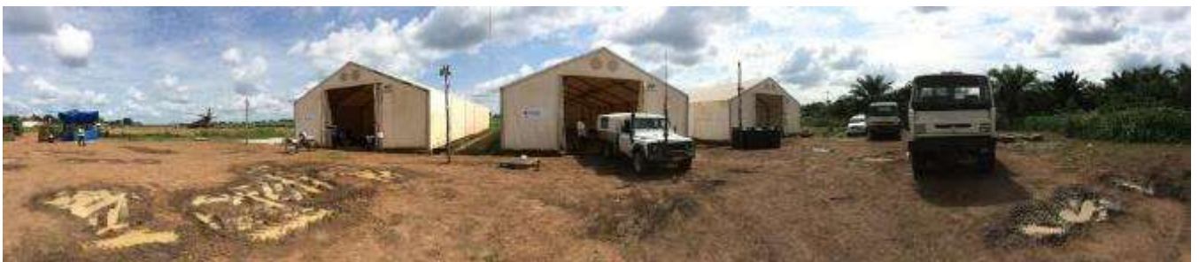
Boende airstrip