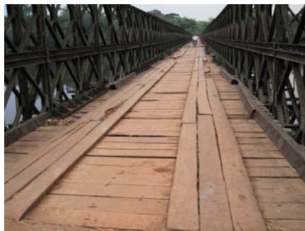
Pont bailey sur la rivière Bomokandi avant et après intervention de Medair (réparation du platelage, des sommiers et boulons manquants, des traverses tordues)