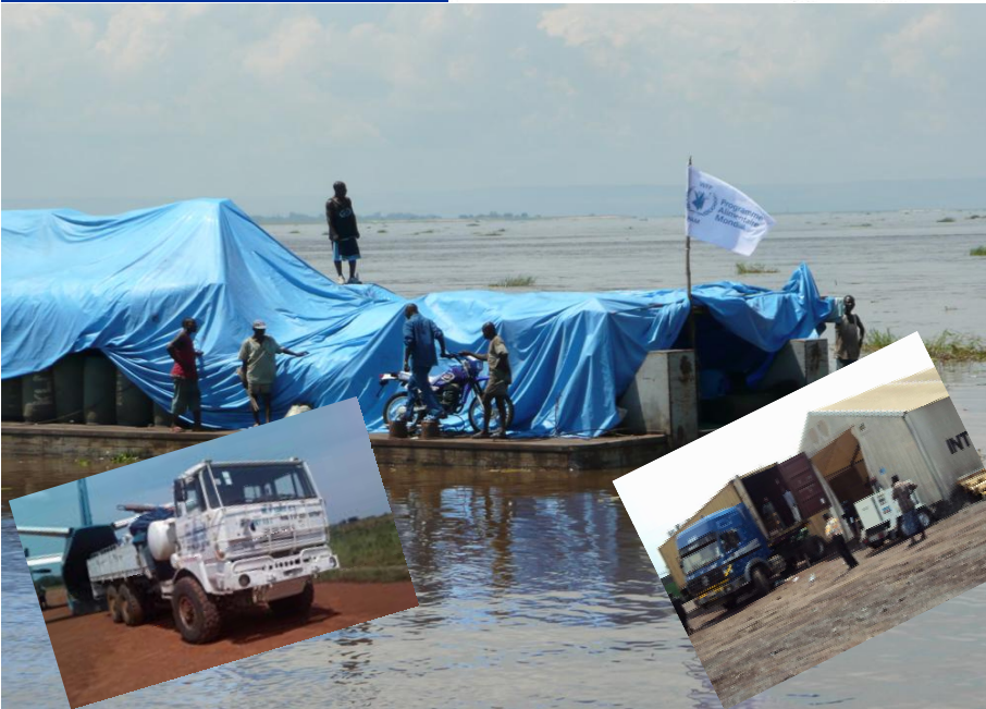
Carte des gaps logistiques (accessibilité) produite par le cluster logistique.

Toutes ces informations sont disponibles dans le document du Plan de contingence qui sera mis à disposition de la Communauté Humanitaire sur www.rdc-humanitaire.net