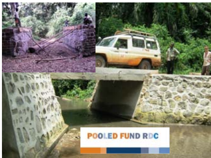
Pont détruit puis reconstruit sur la rivière Mukezo à Dingila

Ce projet financé par le Pooled Fund, permet l'augmentation de l'accessibilité des humanitaires aux 51220 populations déplacées et retournées des territoires d'Ango et Poko, dans le district du Bas Uélé.