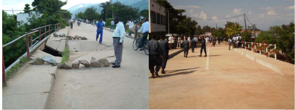
Pont Kimanga avant réparation (à gauche) et après réparation (à droite)

L'effondrement du remblai de la chaussée, des murs de protection en perrés maçonnés et des gabions des murs en aile en aval (rive gauche), avait conduit à la fermeture de passage sur ce pont. Après 4 mois des travaux, l'ouverture au passage sur ce pont a eu lieu le 1er/12/2009. Ceci permet le désenclavement de la zone de santé d'Uvira.