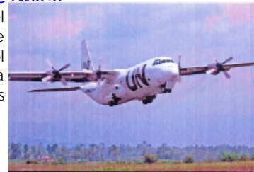
Avion MONUC

http://www.logcluster.org/ops/drc/monuc-flight-schedule-Dec09