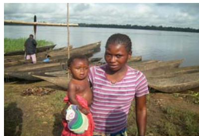
Une rescapée de Dongo en refuge au Congo Brazzaville, (Dongo, 16 novembre 2009)

Le PAM a envoyé à Bétou (nord Congo Brazzaville) 455 mt de vivres dans 23 camions en provenance de la RCA, avec également 8000 litres de fuel pour faciliter l'assistance humanitaire sur place. Un avion cargo affrété, a livré de l'aide médicale et de l'aide humanitaire pour l'OMS, le FNUAP, l'UNICEF à Impfondo (Congo Brazza). Une distribution d'urgence du PAM de 10 tonnes de riz et d'1,5 tonne de biscuits énergétiques a déjà eu lieu à Eboko dans le district de Bétou, pour 187 familles le 22 Novembre.