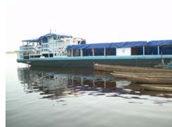
Le HB Bakanja pour le service de transport fluvial humanitaire dans la province de l'Equateur

La première barge est opérationnelle et les organisations qui veulent transporter du cargo ex-Mbandaka dans toute la province d'Equateur sont priées de contacter : cnzengu@caritasdev.cd ou noel.nlandu@wfp.org